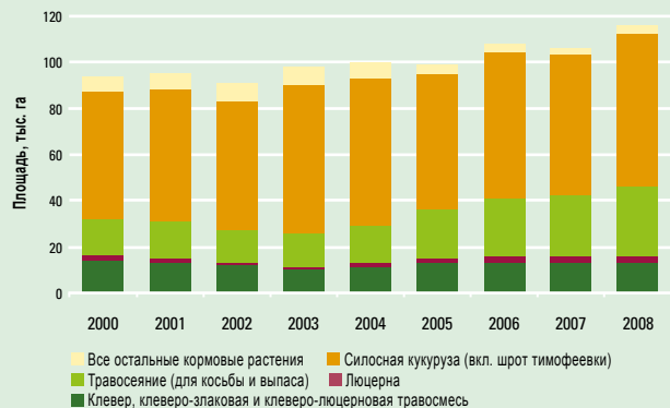
Динамика выращивания полевых кормов в Саксонии с 2000 по 2008 гг.

3) Саксония: предварительные сведения Земельного комитета по статистике, ФРГ: ZMP, структурные данные за