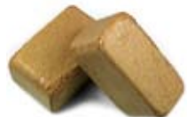
2 kg Holzbriketts