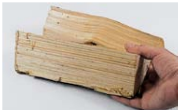
1 kg Fichtenholz