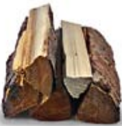
2,5 kg Weichholz