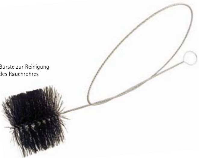
Bürste zur Reinigung des Rauchrohres

Der Schornstein muss deshalb vom Schorn- steinfeger regelmäßig gereinigt werden.