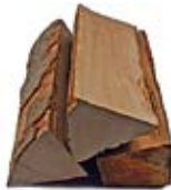
2,5 kg Hartholz