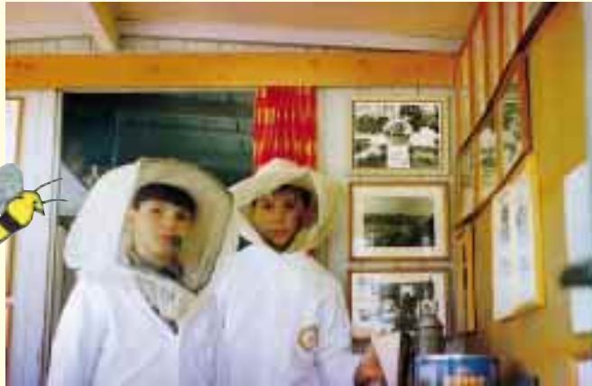
Junge Imker in Schutzkleidung im Lehrbienenstand