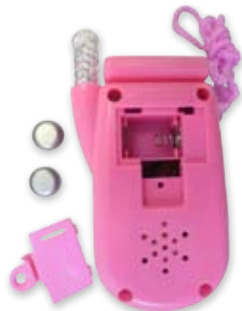
Gefährliche Kleinteile aus dem Batteriefach eines Spielzeughandys

Deutschland: Produktsicherheitsgesetz (ProdSG) Verordnung über die Sicherheit von Spielzeug (2. GPSGV)