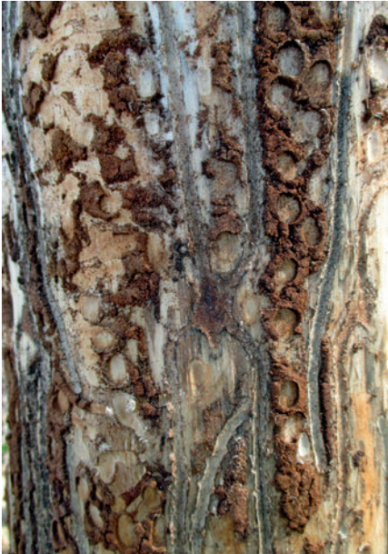
Foto 4: Fraßspuren des Borkenkäfers unter der Rinde; Foto: Stephanie Götze

Absatzproblemen und zum Einbruch der Holzverkaufspreise. Zusätzlich kam es zur Überlastung der zur Verfügung stehenden Aufarbeitungskapazität, also Arbeitskräfte und Technik. Das wiederum war am Anstieg der Aufarbeitungskosten, die für Sturmholz an sich höher sind, deutlich zu spüren. Rasch zeigten sich zudem Grenzen bei der Holzabfuhr, was dazu führte, dass Holzpolter zum Teil monatelang an der Waldstraße lagerten, obwohl die gegebenen Umstände aus Waldschutzgründen einen zügigen Abtransport forderten. Für den Waldbesitzer bedeutet dies erheblich geringere Holzverkaufserlöse, von denen höhere Aufarbeitungskosten und perspektivisch Ausgaben für die Wiederaufforstung zu begleichen sind ; für manchen Forstbetrieb wird das wahrscheinlich auch zur Existenzfrage werden.