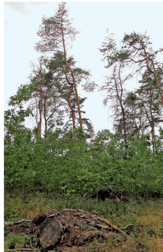
Foto 5: Hoffnungstiftendes Beispiel: Die vor zehn Jahren vom Waldbesitzer gepflanzten Rotkiefern gedeihen unter den Altkiefern, deren Schirm infolge der Sturmholz- und Käferbefallsaufarbeitung 2018 sehr licht geworden ist, und werden einen Teil des zukünftigen Waldes bilden.

■ Territorialfläche: 1.770 km 2 ■ Gesamtwaldfläche: 38.993 ha ■ Staatswald (Freistaat): 13.471 ha ■ Staatswald (Bund): 3.961 ha ■ Körperschaftswald: 2.919 ha ■ Kirchenwald: 550 ha ■ Privatwald: 17.560 ha ■ Treuhandrestwald: 532 ha