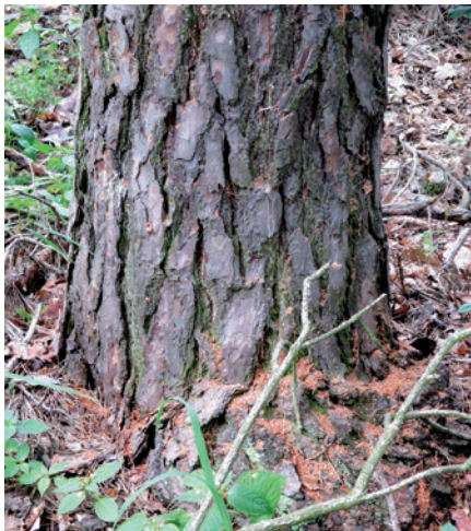
Foto 1: Feines braunes Bohrmehl rieselt am Baumstamm herab, sammelt sich am Stammfuß, hinter Borkenschuppen oder ist auf der Bodenvegetation zu sehen bzw. verfängt sich in Spinnweben.

„Die Summe des im ‚Borkenkäferjahr 2018/19‘ registrierten Stehendbefalls durch holz- und rindenbrütende Käferarten an Nadelbaumarten übersteigt mit 1,15 Mill. m 3 per 31.05.2019 ... die ‚Million!‘. Der Befall hat damit eine Größenordnung erreicht, wie er vermutlich bisher (auf jeden Fall seit 1946) in Sachsen nicht registriert wurde.“ 1 Den aufmerksamen Waldbesitzern in Nordwestsachsen ist es nicht entgangen, dass sich das beunruhigende Waldbild, das ihnen aus dem vergangenen Jahr noch in schmerzlicher Erinnerung ist, vielerorts wieder zeigt und Zeugnis davon ablegt, dass auch die hiesigen Kiefernbestände enorm unter der gewaltigen Käferausbreitung leiden. Diese unheilvolle Entwicklung mit verheerenden Folgen konnte 2018 leider nicht gestoppt werden.