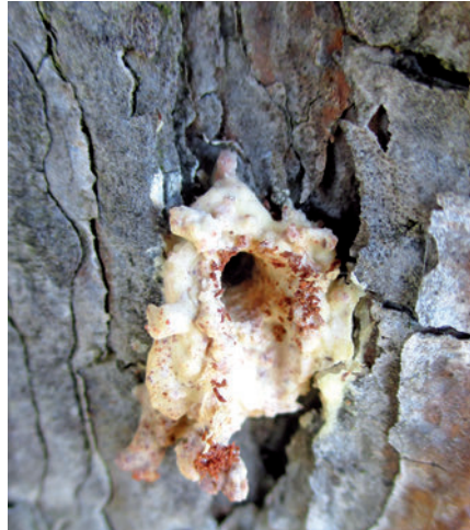
Foto 2: Winziges Einbohrloch in der Borke, umgeben von weißgelbem Harztrichter

gehend Kontakt mit den zuständigen Revierleitern auf, um Erstmaßnahmen wie das Freischneiden von Hauptwegen abzustimmen.