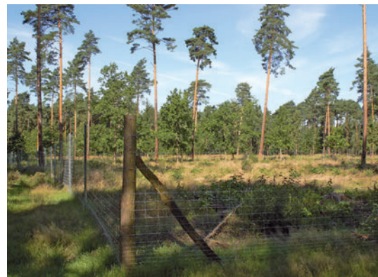
Kahlschlag im Revier Klitten

Adresse: Biosphärenreservatsverwaltung Oberlausitzer Heide- und Teichlandschaft Warthaer Dorfstraße 29, 02694 Malschwitz OT Wartha Leiter Biosphärenreservat: Torsten Roch Telefon: 035932 365-0 Telefax: 035932 365-50 E-Mail: poststelle.sbs-broht@smul.sachsen.de Referatsleiter Betrieb/ Dienstleistung: Jan Prignitz Telefon: 035932 36522 E-Mail: jan.prignitz@smul.sachsen.de Sprechzeiten der Revierförster: Do 16 –18 Uhr