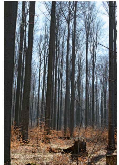
Buchensaatgutbestand im Forstbezirk Neudorf; Foto: Mirjam Oeser

https://publikationen.sachsen.de/bdb/artikel/18532