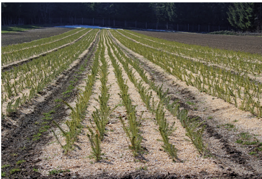
Fichtenpflanzen in der Baumschule

Durch die Auswahl einer auf den jeweiligen Standort passenden Baumart und durch die Nutzung geeigneter Pflanzenherkünfte werden höhere Erträge durch schnelleres Wachstum und gute Schaftformen erreicht und das Risiko von Pflanzenausfällen durch Anfälligkeit gegenüber Schadereignissen verringert.