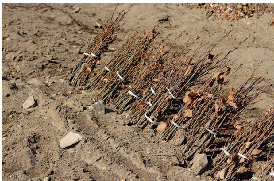
Buchenspflanzen im Pflanzeneinschlag