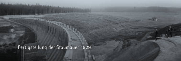
Fertigstellung der Staumauer 1929