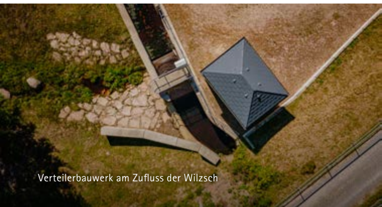
Verteilerbauwerk am Zufluss der Wilzsch

Dafür wurde am Zuflusspegel der Wilzsch eine automatische Messstation installiert. Wird ein festgelegter Huminstoff-Grenzwert überschritten, wird das zulaufende Wasser automatisch in ein separates Rückhaltebecken geleitet. Von dort fließt das Wasser über eine Überleitung direkt in die Wilzsch im Unterlauf – und belastet damit die Talsperre Carlsfeld nicht.