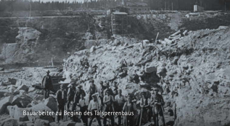
Bauarbeiter zu Beginn des Talsperrenbaus