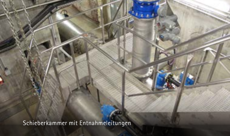
Schieberkammer mit Entnahmeleitungen