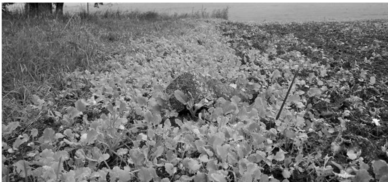
Beschädigte Grenzmarkierung auf Ackerland in der Nähe von Großenhain

Jeder weiß, wie aufwändig das Setzen der Grenzsteine ist. Bitte weisen Sie auch gegebenenfalls Ihre Mitarbeiter auf die Rechtslage hin.