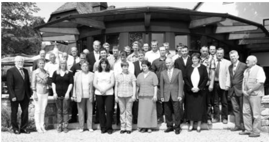
Absolventen des Fachschuljahrgangs 2012/2014

In ihren Grußworten hoben die Vertreter des Berufsstandes hervor, dass eine nachhaltige und umweltverträgliche, aber dennoch existenzsichernde Landwirtschaft sehr wichtig ist, woraus sich die Notwendigkeit von laufenden Fortbildungen ergibt. Die Fachschule reagiert darauf mit handlungsorientierten und laufend aktualisierten Lerninhalten, um die Übertragung des Unterrichtsstoffes in die betriebliche Praxis zu gewährleisten.