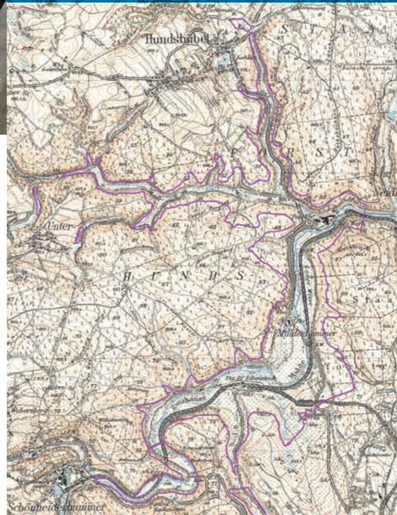
Das Muldetal 1937 vor dem Bau der Talsperre Eibenstock