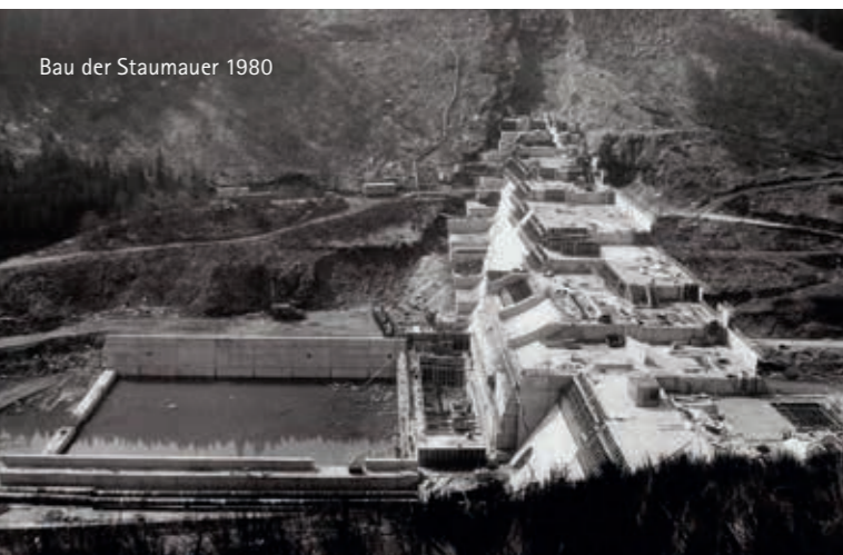
Bau der Staumauer 1980

Die Größe der Talsperre, die neben dem Stausee eine Vorsperre und vier Vorbecken umfasst, brachte eine vergleichsweise lange Bauzeit mit sich. 1984 war die Staumauer der Hauptsperre und erst 1987 die gesamte Anlage fertiggestellt. In Betrieb genommen wurde die Stauanlage jedoch schon wesentlich früher: 1982 wurde das erste Wasser über den Rohwasserablastungsstollen an das Wasserwerk Burkensdorf abgegeben. Die festliche Einweihung der Talsperre fand am 20. Juni 1986 statt.