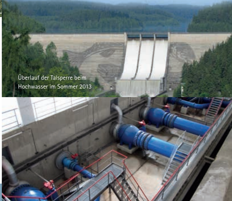
Überlauf der Talsperre beim Hochwasser im Sommer 2013

Im Sommer 2012 entstand an der Staumauer ein großformatiges Kunstwerk. Der Künstler Klaus Dauven schuf hier das Bild zweier Forellen, die er mit einem Wasserstrahl aus der bis zu 30 Jahre alten Schmutzschicht herausarbeitete. Heute sind die Flächen wieder nachgedunkelt – das Kunstwerk auf Zeit ist verschwunden.