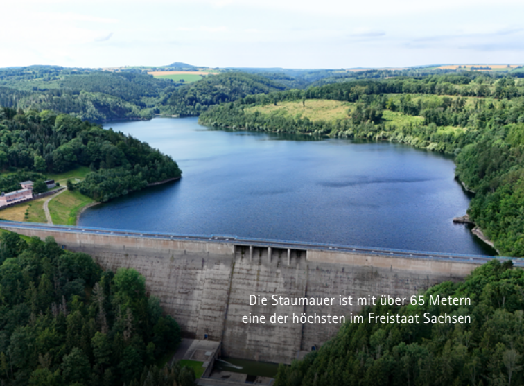
Die Staumauer ist mit über 65 Metern eine der höchsten im Freistaat Sachsen

Wird die Talsperre Gottleuba bei einem Hochwasser bis über den gewöhnlichen Hochwasserrückhalteraum hinaus eingestaut, setzt die Hochwasserentlastung ein. Hierfür gibt es einen 40 Meter breiten Hochwasserüberfall. Er besteht aus vier Feldern, die eine Wassermenge von 176 Kubikmetern pro Sekunde über den Mauerrücken zum Tosbecken hin abführen können.