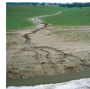
Bodenabtrag durch Wassererosion in Abflussbahnen ist ein großes Problem für den Denkmalschutz.