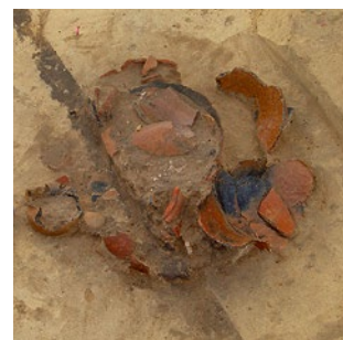
Die zu tiefe Bodenbearbeitung mit Pflug oder Bodenmeißel zerstört archaische Strukturen wie dieses Urnengrab aus Weißkollm (Lkr. Bautzen).