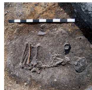
Diese jungsteinzeitliche Hockerbestattung von Hof, Lkr. Nordsachsen, (um 3000 v.Chr.) entging der Zerstörung, obwohl sie sich direkt unter der Pflugsohle befand.

Sachsen ist reich an archäologischen Denkmalen. Sie haben Tausende von Jahren im Boden überdauert und dokumentieren eine Zeit, aus der es keine schriftlichen Aufzeichnungen gibt. Derzeit sind in Sachsen etwa 13.000 archäologische Denkmale bekannt. Dazu zählen z. B. Lagerplätze steinzeitlicher Jäger, Dörfer jungsteinzeitlicher Bauern oder bronzezeitliche Burgen. Gräber bieten Einblicke in Jenseitsvorstellungen, soziale Verhältnisse und demografische Entwicklungen. In vorgeschichtlichen Hortfunden spiegeln sich weiträumige wirtschaftliche und soziale Beziehungen wider.