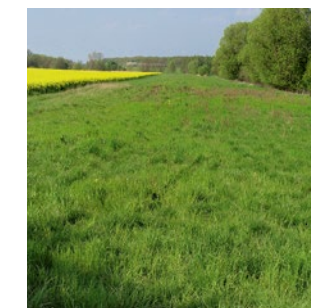
Durch »grüne« Streifen und durch die Anlage von Grünland schützen Landwirte Denkmale.

Landwirte können archäologische Denkmale durch verschiedene Maßnahmen schützen: durch pfluglose Bodenbearbeitung, »grüne« Streifen, mehrjährige Brachen oder durch die Anlage von Grünland. Der Einsatz gefügeschonender Technik bewahrt das Bodengefüge und damit auch das Denkmal. Eine moderne, teilflächenspezifische Bewirtschaftung ermöglicht über Denkmalen eine flache Bodenbearbeitung von weniger als 25 cm. Flurbereinigungsverfahren und Ökokontoflächen schaffen Voraussetzungen, archäologisch wertvolle Flächen dauerhaft zu schützen.