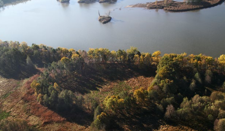
Die Sumpfschanze Biehla (Lkr. Bautzen): Im feuchten Untergrund sind auch organische Reste von Siedlung und Wall erhalten.