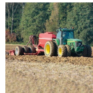
Landmaschinen mit Niederdruck- und Zwillingsreifen schützen das Bodengefüge und Denkmale vor Verdichtung.