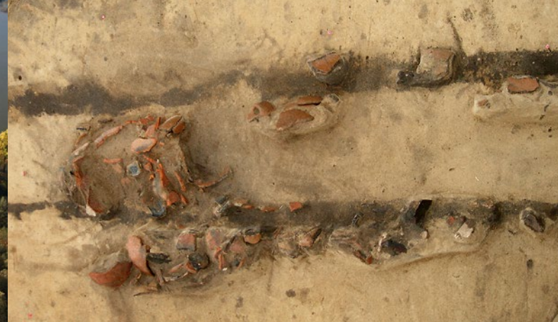
Dieses bronzezeitliche Urnengrab wurde durch die tiefgreifende Bodenbearbeitung fast vollständig zerstört.