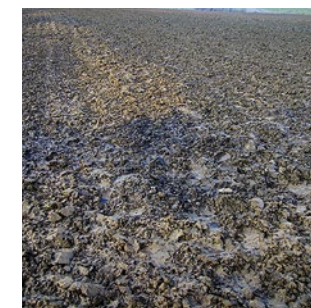
Helles Unterbodenmaterial und dunkle Verfärbungen sind untrügliche Hinweise für Schäden durch zu tiefes Pflügen im Bereich eines Denkmals.

Das Archiv im Boden ist gefährdet. Durch Bodenbearbeitungsgeräte werden Fundstücke verschleppt und Wallanlagen oder Grabhügel eingeebnet. Bodenabtrag durch Wasser und Wind legt die Denkmale frei und gibt sie dem Verfall preis. Zu hoher Druck auf den Boden führt zu Verdichtungen der Denkmale.