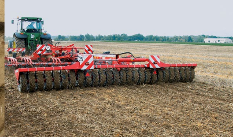
Grubber statt Pflug: Denkmale werden geschützt, wenn der Boden flach und pfluglos bearbeitet wird.