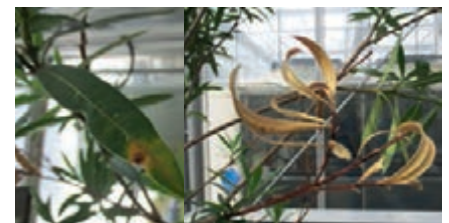
Symptome an Oleander