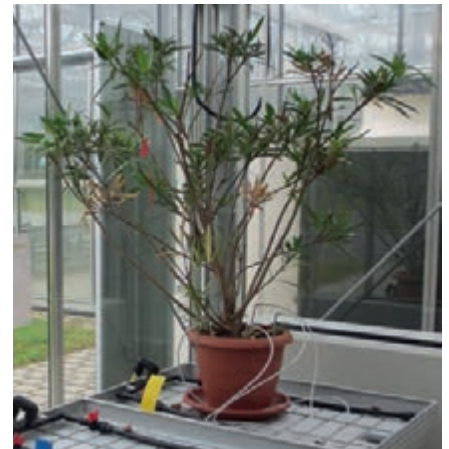
Befallene Oleanderpflanze in Sachsen

Referat Pflanzengesundheit, Waldheimer Straße 219, 01683 Nossen Telefon: 035242 631-9333, E-Mail: pflanzengesundheit@smul.sachsen.de