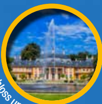
Schloss und Park Pillnitz