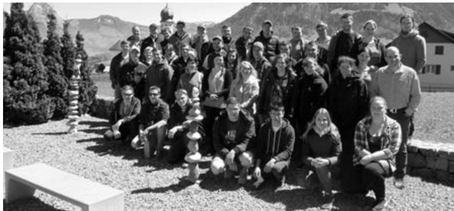
Die schweizer und sächsischen Schüler beim diesjährigen Schüleraustausch in der Schweiz

Im Rahmen einer Partnerschaft mit dem Bildungszentrum Wallierhof Riedholz führen bereits zum 10. Mal ostsächsische Fachschüler und Lehrlinge in die Schweiz.