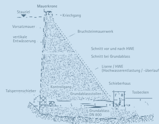
Querschnitt der Staumauer

Das Rohwasser zur Trinkwasseraufbereitung kann an der Talsperre Sosa aus unterschiedlichen Wasserschichten entnommen werden. Dazu gibt es zwei Entnahmestellen in unterschiedlichen Höhen. Nach der Entnahme gelangt das Wasser über Rohrleitungen durch die Staumauer. Kurz unterhalb der Staumauer münden die Leitungen in einem unterirdischen Hangkanal, der bis zum Wasserwerk führt.