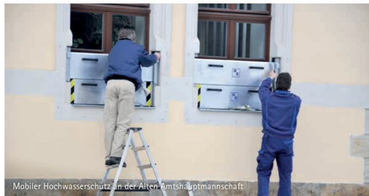
Mobiler Hochwasserschutz an der Alten Amtshauptmannschaft