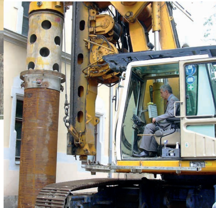
Der damalige Umweltminister Stanislaw Tillich beim Baustart

Insgesamt wurden in Grimma rund 57 Millionen Euro in den Hochwasserschutz investiert, finanziert aus Mitteln des Freistaates Sachsen, des Bundes sowie vom Europäischen Fonds für regionale Entwicklung (EFRE).