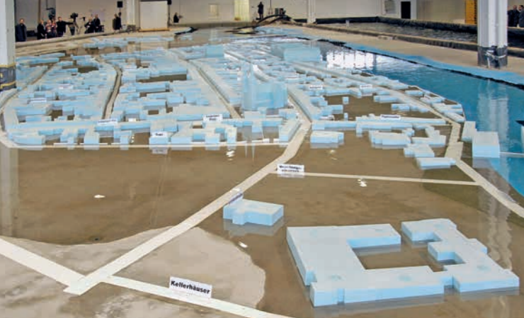
Physikalisches Modell der Stadt Grimma