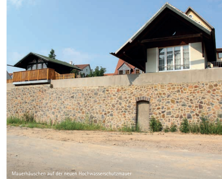
Mauerhäuschen auf der neuen Hochwasserschutzmauer

Der Bau der oberirdischen Mauer begann im September 2012, nachdem die Anlagen im Untergrund fertiggestellt waren. Insgesamt ist dieser Abschnitt rund 500 Meter lang.