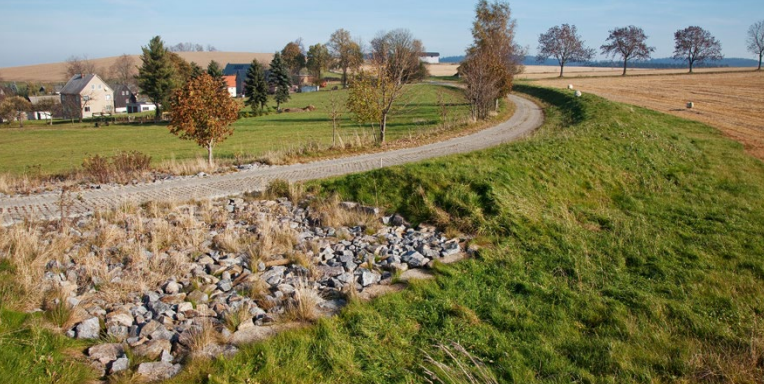
Hochwasserrückhaltedamm mit Dammschicht und ausgebautem Wirtschaftsweg

Die Laufzeit eines Flurbereinigungsverfahrens ist maßgeblich von der Gebietsgröße und den angestrebten Zielen abhängig. Eine zeitliche Beschränkung gibt es nicht. Freiwillige Landtausche dauern teilweise deutlich kürzer als ein Jahr, die Bearbeitung eines Regelverfahrens kann auch zehn oder mehr Jahre benötigen. Die eigentliche Umsetzung der einzelnen Vorhaben, wie Bau- und Pflanzmaßnahmen, erfolgt auch in den größeren Verfahren meist innerhalb der ersten fünf Jahre.