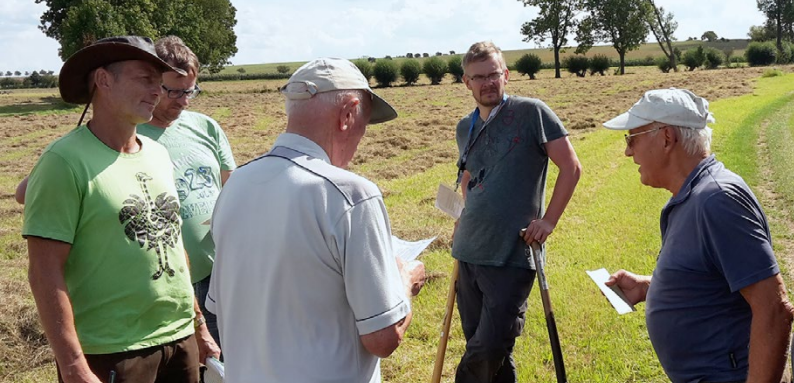
Vertreter der Teilnehmergeinschaft und landwirtschaftliche Sachverständige bei der Überprüfung der Wertermittlungsergebnisse

Da in den Verfahren meist sehr viele Teilnehmer beteiligt sind, wählen diese aus ihrem Kreis einen Vorstand, der ihre Interessen vertritt. Als Vorstandsvorsitzende/r wird ein/e fachlich versierte/r Mitarbeiter/in aus der Flurbereinigungsverwaltung eingesetzt. Der Vorstand gibt unter anderem Auskunft zum aktuellen Stand des Verfahrens und ist Ansprechpartner für alle Anliegen der Beteiligten.