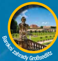
Barokní zahrady Großsedlitz