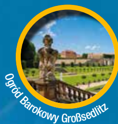
Ogród Barokowy Großsedlitz