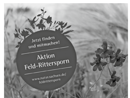
Feldrittersporn; Foto: Archiv Naturschutz LfULG, C. Schneier