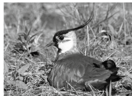
Kiebitz; Foto: Archiv Vogelschutzwarte Neschwitz, Dirk Synatschke