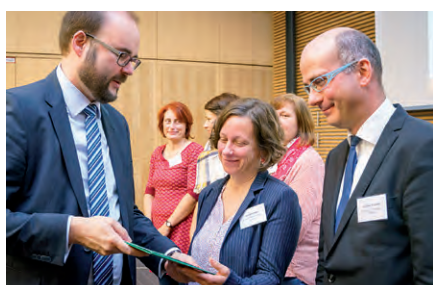
Wertschätzung und Auszeichnung durch den Staatsminister

Die Form der Beteiligung von Team und Eltern ist neben dem gemeinsamen Modellbau über Elternabende zum Thema oder die Einladung von externen Fachkräften für eine Teamweiterbildung möglich. Darüber hinaus ist die Bildung von Gartenteams und die Festlegung von Verantwortlichkeiten z. B. durch Vergabe von Pflanzpatenschaften sinnvoll. Arbeitseinsätze, Sammel- und Spendenaktionen stellen weitere Möglichkeiten dar. Auch Großeltern können mit ihrem Wissen, ihrer Erfahrung und ihrer Zeit einbezogen werden. Kinder-Garten kann in diesem Zusammenhang als Ort der Begegnung von Generationen verstanden und gestaltet werden.