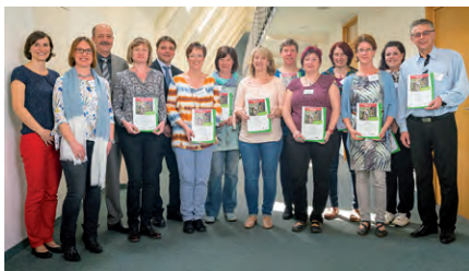
2. Prämierung am 11. April 2018

Im Januar ist der 5. Kinder-Garten-Wettbewerb gestartet. Bis zum 31. Mai konnten sich alle sächsischen Kitas und Kindertagespflegestellen für den Wettbewerb anmelden und ihre Bewerbungen bei der SLfG einreichen. In der Zeit vom 8. bis zum 17. Mai fanden Exkursionen zu ehemaligen Landessiegern des Wettbewerbs statt. In diesem Rahmen öffneten die Kita „Entdeckerland“ Leubsdorf, Kita „Saatkorn“ Hohndorf, Kita „Eckstein“ Dresden, Kita „Naturkinder“ Weißbach und die Kita „Spatzennest“ Zschopau ihre Gartentore (siehe Kapitel 1.3). Anhand von pädagogischen und landschaftsgestalterischen Kriterien wählte die Fachjury aus allen 47 Bewerbern die 30 Einrichtungen für die 2. Stufe (siehe Kapitel 2.1) aus. Am 23. Juni 2017 wurden diese Einrichtungen von Staatsministerin Brunhild Kurth (a. D.) ausgezeichnet und erhielten jeweils ein Preisgeld von 400 Euro.