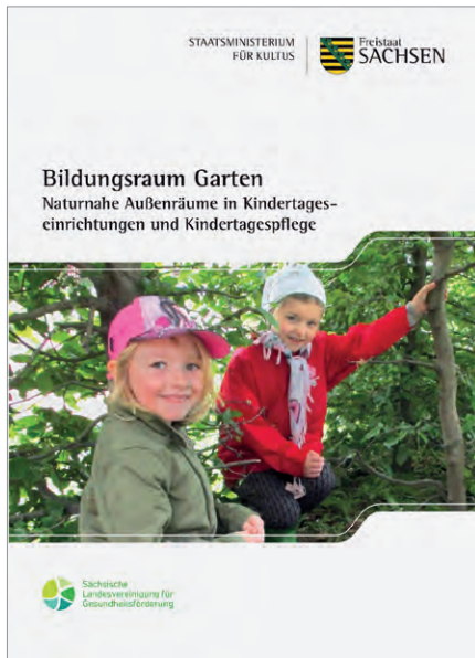
Broschüre „Bildungsraum Garten“