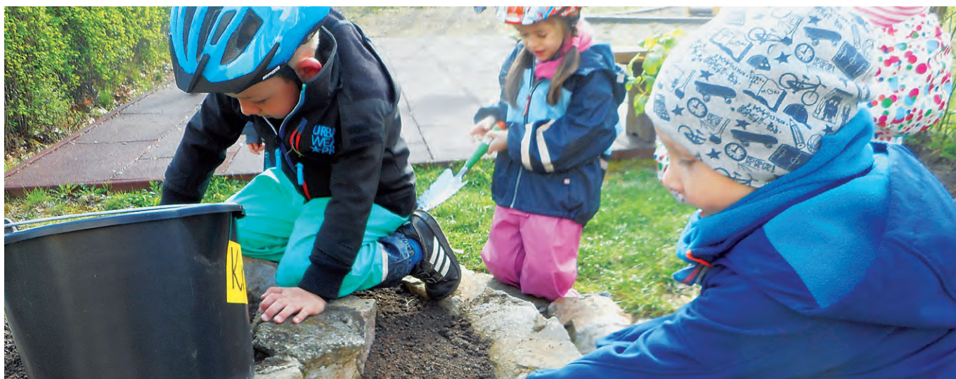
Kinder helfen mit