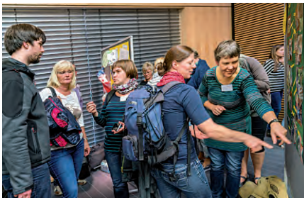
10. Fachtagung am 28. September 2017