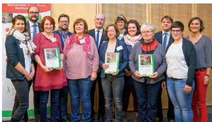
3. Prämierung am 24. Oktober 2018

Während der 2. Stufe konnten die Kitas und Kindertagespflegestellen ihre Vorhaben weiter ausbauen. Was bis dahin alles passiert ist und welche Pläne für die weitere Gartengestaltung noch bestehen, führten die Einrichtungen in einer Dokumentation auf, die sie bis 23. Januar 2018 bei der SLfG einreichten. Zur fachlichen Weiterbildung fand am 28. September 2017 die 10. Fachtagung „Unser Kinder-Garten – ein naturnaher Bildungs- und Erlebnisraum“ statt (siehe Kapitel 1.3). Am Ende der 2. Stufe wählte die Fachjury zehn Einrichtungen (siehe Kapitel 2.2) für die 3. Stufe aus, die am 11. April 2018 offiziell mit einem Preisgeld in Höhe von je 1.000 Euro ausgezeichnet wurden.