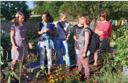
Die Jury vor Ort