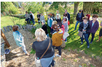
Exkursion 2017, „Naturkinder“ Weißbach