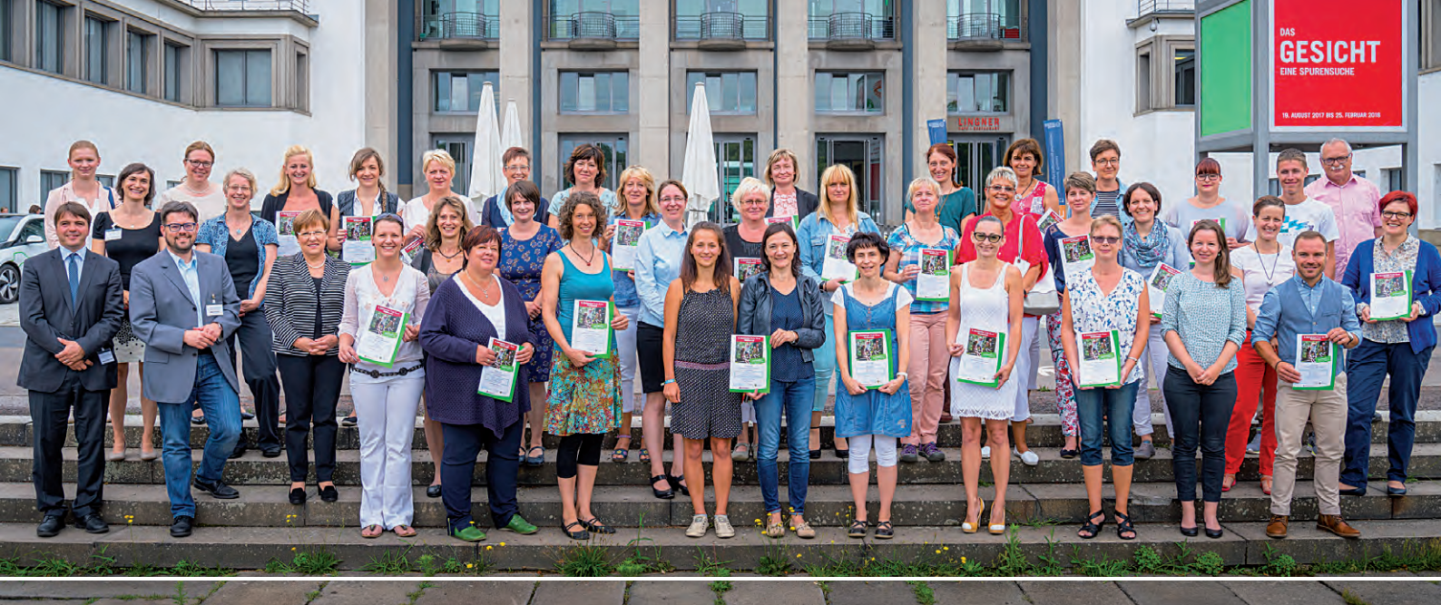
1. Prämierung am 23. Juni 2017