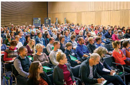
11. Fachtagung am 24. Oktober 2018