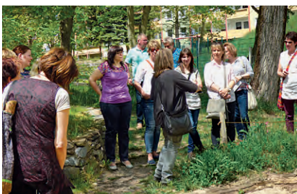
Exkursion 2018, „Spatzennest“ Zschopau

Ein wichtiger Teil des Wettbewerbs ist das Begleitprogramm als Angebot zur fachlichen Weiterbildung und für den Transfer guter Praxisbeispiele. In diesem Rahmen werden jährlich Fachtagungen und Exkursionen zu ehemaligen Landessiegern des Wettbewerbs durchgeführt. Die Fortbildungen richten sich zum einen an die Wettbewerbsteilnehmer, um diese während ihrer Gartengestaltung fachlich zu begleiten und ihnen Möglichkeiten des Austauschs zu geben. Zum anderen sind alle Interessierten aus sächsischen Kitas, Kindertagespflegestellen, Träger, Eltern, Fachberatung, Spielraumgestaltung sowie Multiplikatoren aus dem Bildungs-, Sozial- und Gesundheitsbereich eingeladen, sich zu beteiligen.