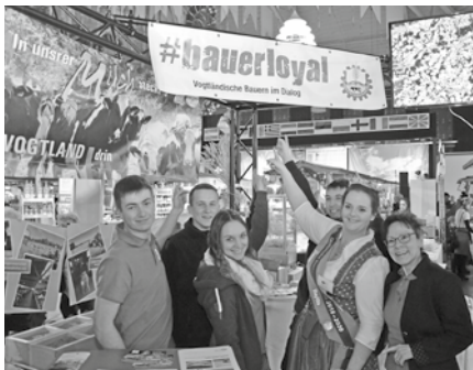
Freude über den Publikumspreis für die beste Stand- und Verkaufsgestaltung