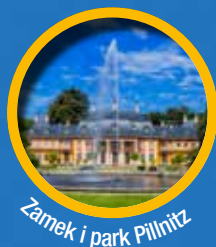
Zamek i park Pillnitz