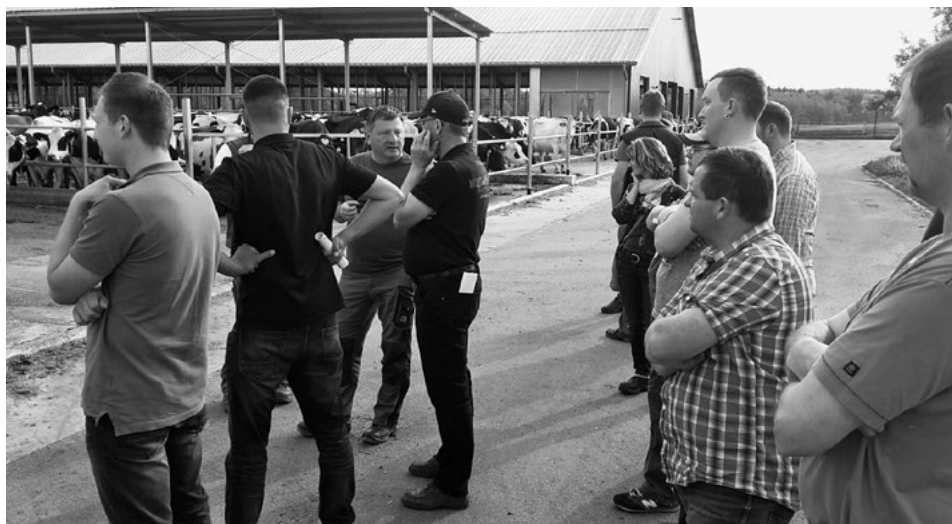
Besichtigung des Laufhofes