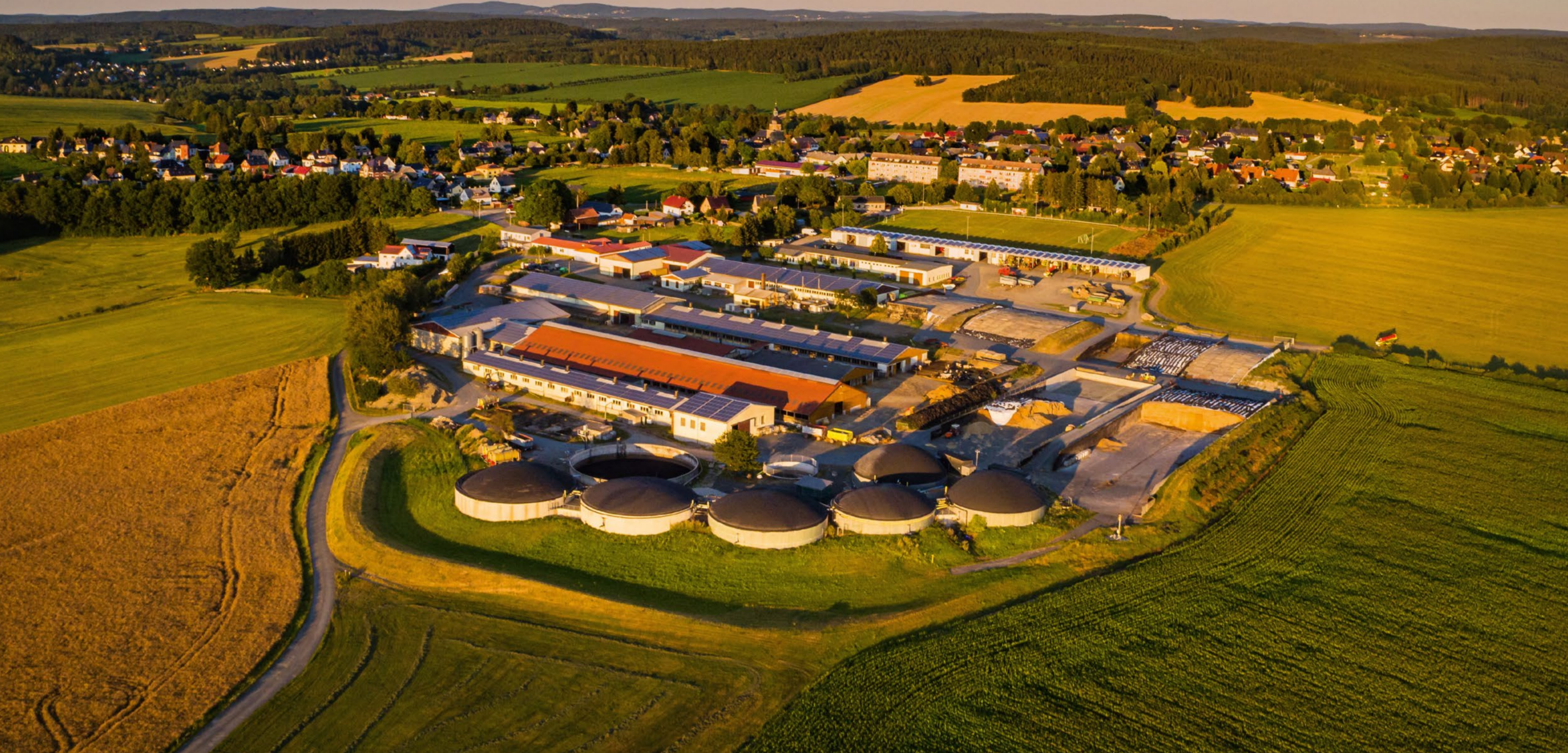
Regionale Energiekreisläufe, hier in Theuma/Vogtland: Wir bewilligen Fördermittel und begleiten biogaserzeugende Landwirtschaftsbetriebe bei der Wärme- und Stromproduktion.

Täglich für ein gutes Leben. 22.8. Anwenderseminar DLG – Herdenmanager 24.8. Versuchsfeldbegehung Buschbohnen 25.8. Versuchsfeldbegehung ökologischer Apfelanbau Aktuelle und detaillierte Informationen unter www.lfulg.sachsen.de/veranstaltungen.html