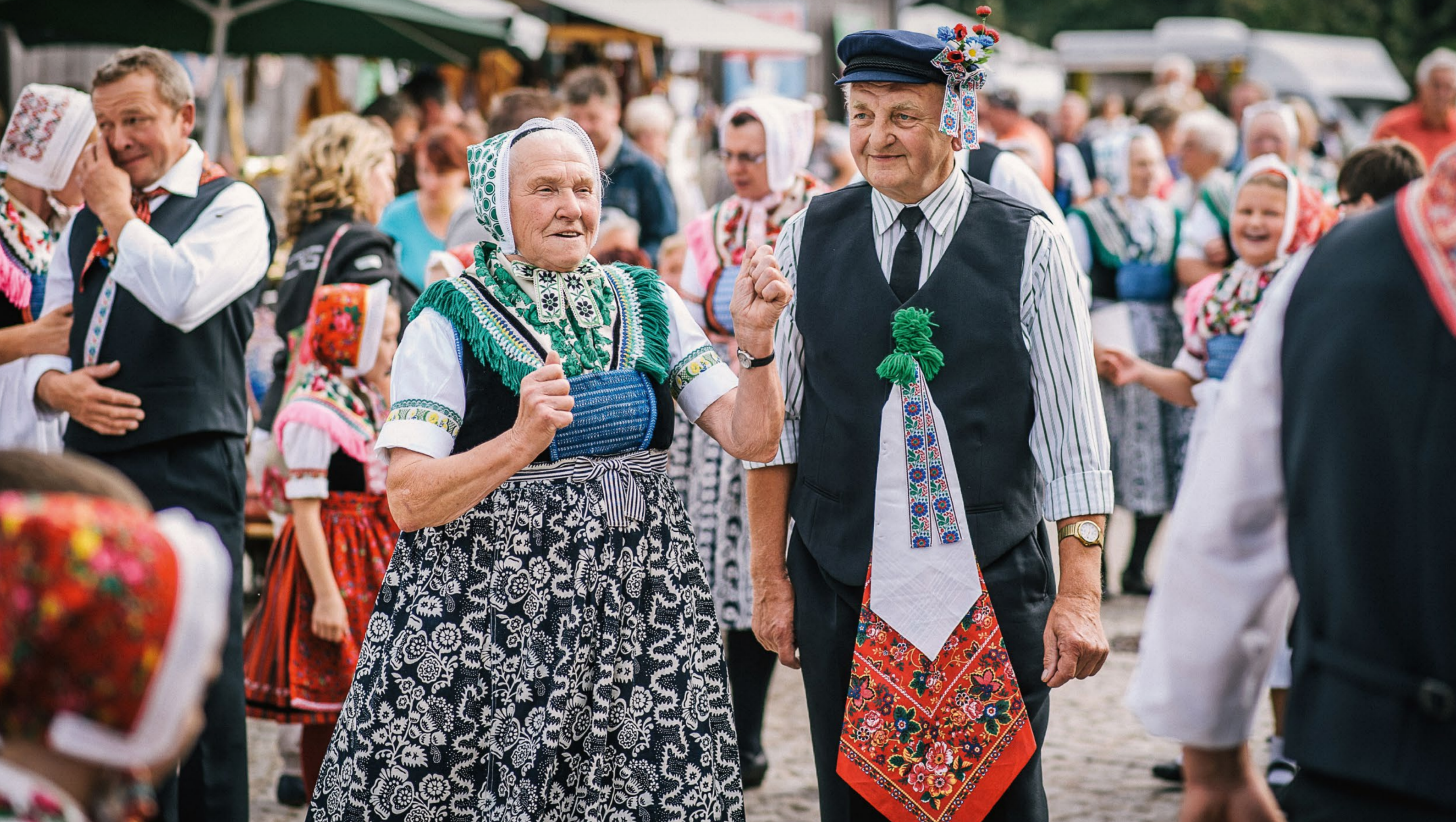
Regionalmarkt in der Oberlausitz: Wir gewährleisten die Einhaltung der Vermarktungsnormen bei Obst, Gemüse, Eiern und Geflügelfleisch.

Täglich für ein gutes Leben. 6.4. Grundlagenkurs Schweinehaltung für Quereinsteiger 10.4. Einstieg in die Zucht I: Auswahl von Hengst & Stute und Organisatorisches 13.4. Sächsisches Gewässerforum 13.4. Praktische Geflügelhaltung – Gesundheitsmanagement 14.4. Feldtag mit Maschinenvorführung „Umbruch grüner Pflanzenbestände“ 14.4. Praktikerschulung Kuhsignale 15.4. Workshop Herdenschafhaltung – aktuelle Fördermöglichkeiten 15.4. Fachvortrag im Rahmen des Geokolloquiums 17.4. Anwenderseminar Homöopathie beim Rind anwenden – Notfallapotheke und Arzneimittelherstellung 17.4. Grundlehrgang Imkerei – Teil IV Honiggewinnung und -vermarktung 20.4. Grünlandseminar „Aktuelle Mischungen und Sorten für Nach- und Neuansaat im Futterbau“ 20.4. Versuchsbesichtigung Lagerzwiebeln 21.4. Technik der Innenwirtschaft (TDI)-Schulungstag – „Tierortung und Trackingsysteme“ 21.4. Versuchsbesichtigung Beet- und Balkonpflanzen 22.4.–25.4. agra Landwirtschaftsmesse 22.4. Fachvortrag im Rahmen des Freiburger Kolloquiums 24.4. Grundlehrgang Imkerei – Teil V Bienengesundheit 26.4. Elektrofischereilehrgang 27.4. Praktikerschulung Gesunde Kühe automatisch melken 28.4. Feldtag „Pflanzenbauforschung – Mulchtransfer, Sensoreinsatz in der Unkrautregulierung und Leguminosenanbau“ 28.4. Köllitscher Fachgespräch zur Transport- und Schlachtwürdigkeit von Rindern 28.4. Grünlandseminar „Gatterwild“ Aktuelle und detaillierte Informationen unter www.lfulg.sachsen.de/veranstaltungen.html