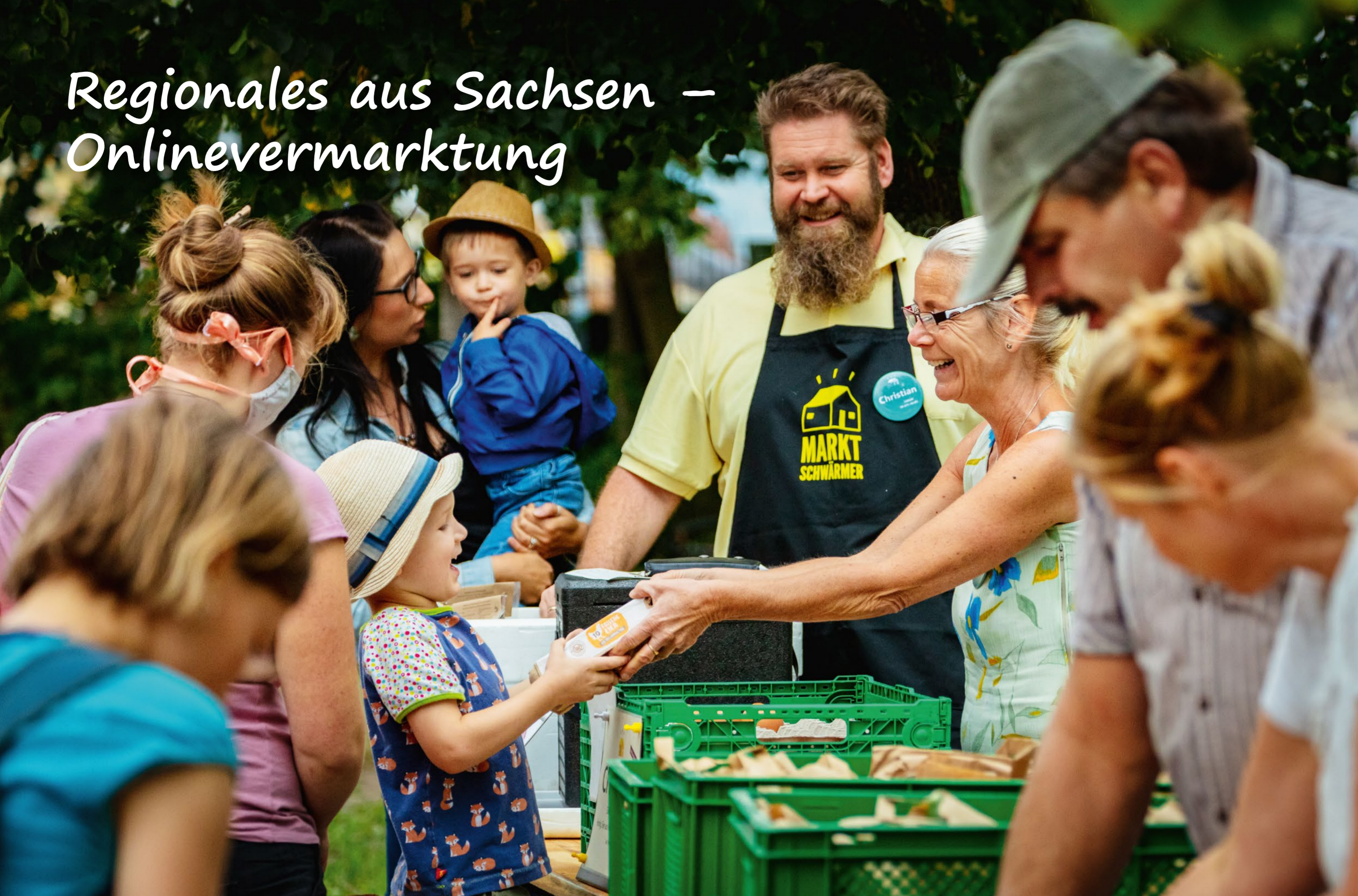
Markschwärmer in Dresden: Wir stärken regionale Initiativen mit dem Online-Portal „REGIONALES.SACHSEN.DE“

Täglich für ein gutes Leben. 1.7. Haltung von Herdenschutzhunden 1.7. Feldtag Forchheim 3.7. Tafelsilber der Natur – 2. Exkursion: Naturschutzgebiet Biehla-WeiBig 8.7. Fachvortrag im Rahmen des Geokolloquiums 14.7. Beet- und Balkonpflanzentag 15.7. Fachvortrag im Rahmen des Freiburger Kolloquiums 20.7. Digitales Nährstoffmanagement, Teil III Proteintragskartierung Winterweizen zur Ernte 22.7. Hunde, Hüten und Landschaftspflege Aktuelle und detaillierte Informationen unter www.lfulg.sachsen.de/veranstaltungen.html