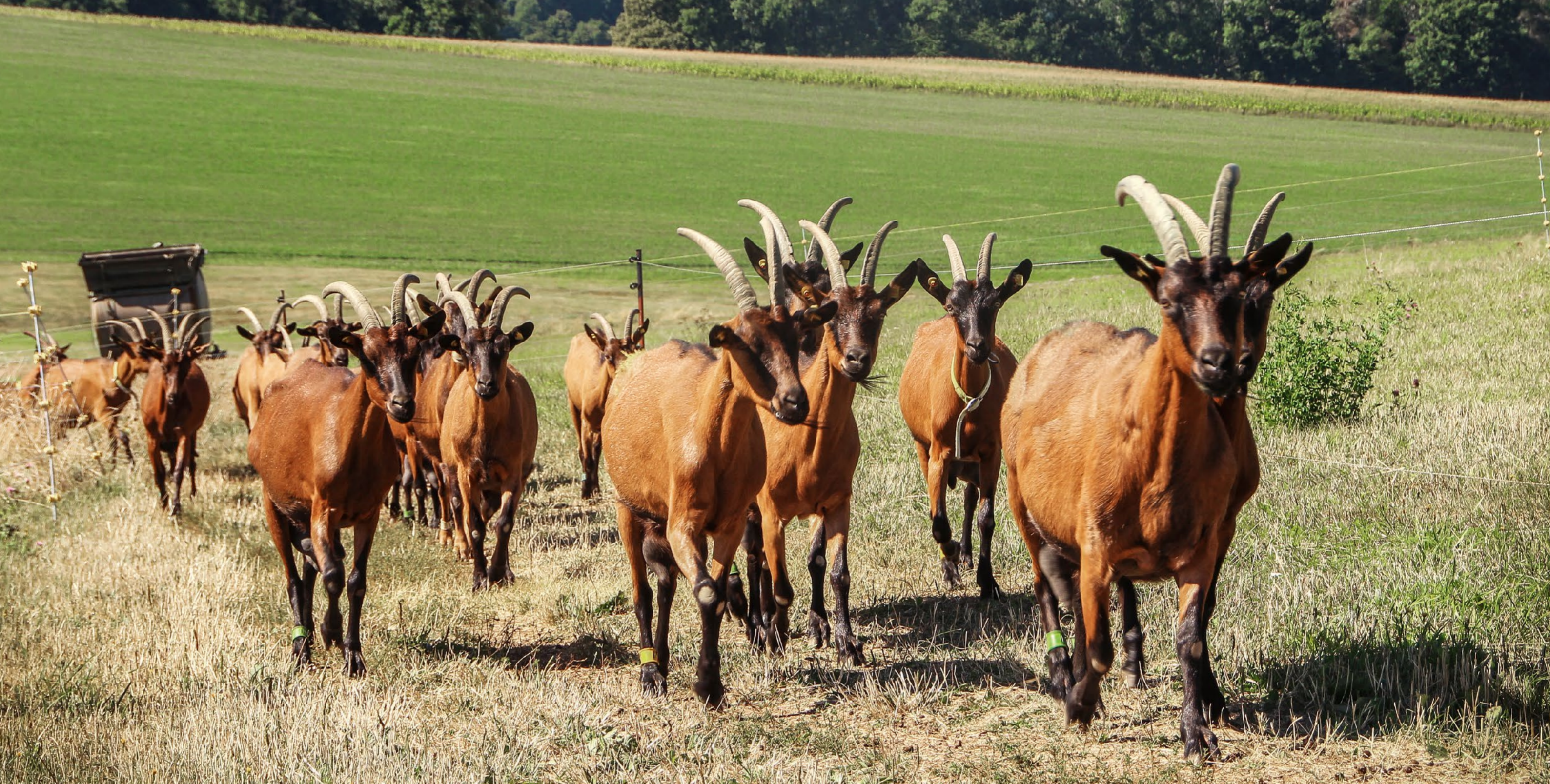
Biohof bei Stolpen: Wir unterstützen eine artgerechte und wirtschaftliche Tierhaltung.

Täglich für ein gutes Leben. 1.9. Versuchsfeldführung Kernobst 2.9. Weiterbildung der Berufsschullehrer 3.9. Pillnitzer Rosentag 4.9. Sächsischer Kaninchentag 9.9. Fachtagung Qualitätsgetreide 9.9. Feldtag „Betriebsplan Natur – Dialog schafft Lösungen“ 9.9. Fachvortrag im Rahmen des Geokolloquiums 18.9. Waldfest Konzertplatz Weißer Hirsch Dresden – Informationsstand zum Wolf 19.9. Tag des Geotops – Exkursion ins Westerzgebirge 21.9. Praktikerschulung Biogaserzeugung für Anlagenfahrer (Teil I) 21.9. Sächsischer Geflügeltag 22.9. Fokusabend Pferdepraxis II: Entwurmungsmanagement 22.9. Workshop „Nutzt Sensorik im Milchviehstall?“ 23.9. Fortbildung Grundwassermonitoring und -probennahme 23.9. Workshop Herdenschafhaltung – Nachweisführung 23.9. Fachvortrag im Rahmen des Freiburger Kolloquiums 25.9. Sächsischer Fleischrindtag 30.9. Hoftag zum Beweidungsprojekt Aktuelle und detaillierte Informationen unter www.lfulg.sachsen.de/veranstaltungen.html