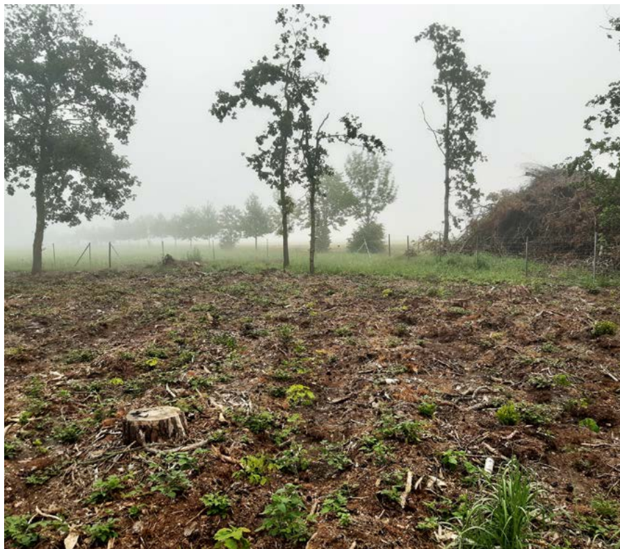
Abb. 1: Waldumbau außerhalb von Schutzgebieten – Abholzung des durch Käfer und Trockenheit geschädigten Kiefernbestandes mit anschließender Wiederaufforstung von Laubbaumarten (Traubeneiche, Stieleiche, Roteiche, Rotbuche, Esskastanie, Bergahorn und Douglasie)

Mit rund 200 Anträgen verteilt auf sieben Jahre wurden am meisten Waldumbaumaßnahmen außerhalb von Schutzgebieten beantragt, gefolgt von der Verjüngung innerhalb von Schutzgebieten. In diesem Zeitraum wurden durch den Landkreis Nordsachsen zwei neue Waldbrandüberwachungsanlagen mit-