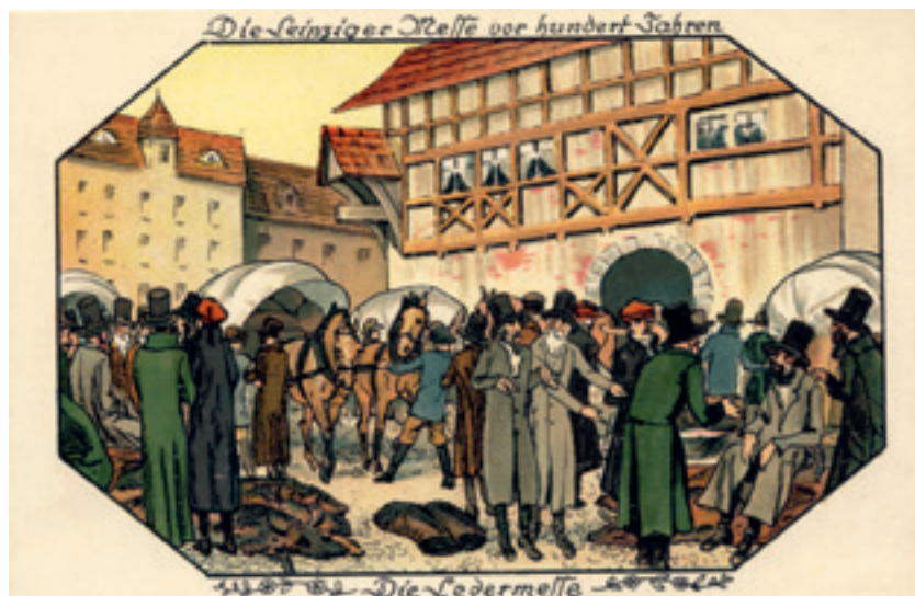
Die Ledermesse in Leipzig, Postkarte, ungelauten, Richard Schlothauer, Leipzig

Die einzige Ausnahme bei diesen Verordnungen bildete der Besuch der Leipziger und Naumburger Messen. Für die Leipziger Messen sind beeindruckende Zahlen der „Messefremden“ für die Zeit von 1747 bis 1840 überliefert. Die Zahl der Messejuden stieg in jenen Jahrzehnten kontinuierlich an, obwohl ihre Bewegungsräume streng überwacht wurden. 30 Für die böhmischen und mährischen Juden galt zum Beispiel,