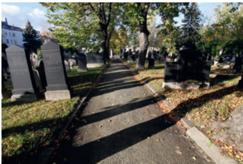
Der Alte Israelitische Friedhof in Leipzig

dahin hatten sie ihre Verstorbenen in Dessau und Naumburg beisetzen müssen. 35 In den Folgejahrzehnten nahm die Zahl der in Leipzig lebenden Juden rasch zu.