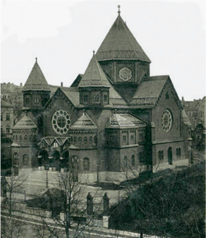
Chemnitzer Synagoge am Stephanplatz, 1899

fortan die in den Amtshauptmannschaften Chemnitz, Flöha, Glauchau und Stollberg wohnhaften Juden. Darüber hinaus wurde die Amtshauptmannschaft Rochlitz infolge Streitigkeiten innerhalb der Gemeindeverwaltungen aus der Zuständigkeit der Leipziger jüdischen Gemeinde herausgelöst und dem Chemnitzer Gemeindebezirk offiziell zugeordnet. Aufgrund der geographischen Nähe zu Chemnitz war dadurch eine bessere religiöse Betreuung der Juden in Mittweida, vor allem der dort lebenden Technikumbesucher, möglich.