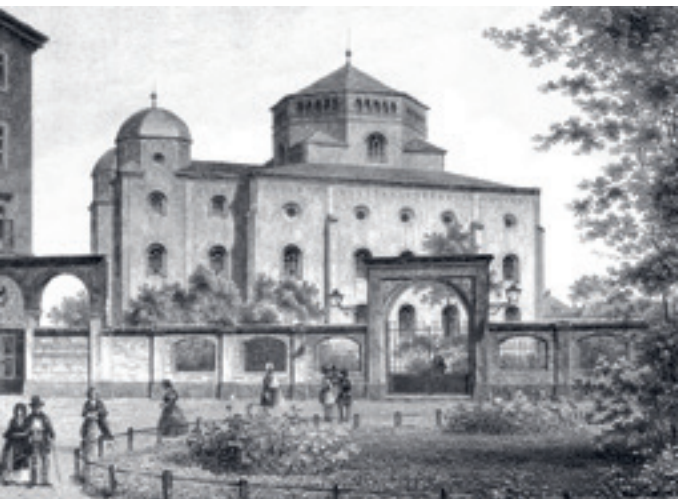
Alte Dresdner Synagoge von Gottfried Semper („Semper-Synagoge“), erbaut 1839–1840, zerstört 1938, Lithographie von L. Thümling um 1860

In Dokumenten, Objekten und Erinnerungsstücken wird die Entwicklung jüdischer Gemeinden und Organisationen sowie das Wirken jüdischer Persönlichkeiten in Wirtschaft, Kultur und Stadtgesellschaft rekonstruiert. Sie geben neben einem historischen Überblick auch einen Einblick in die Einzelschicksale jüdischer Bürgerinnen und Bürger, zum Beispiel durch Zeitzeugenberichte von Überlebenden der Shoah.