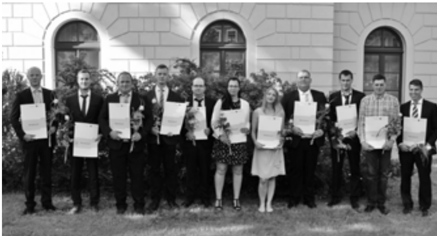
Die erfolgreichen Landwirtschaftsmeister des Großenhainer Kurses