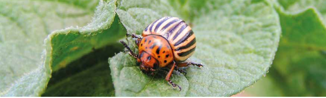
Bild 5: Kartoffelkäfer lassen sich im Larvenstadium mit einem Präparat auf Basis von Neem bekämpfen

Beikräuter werden in erster Linie über die Fruchtfolgegestaltung sowie die Förderung der Konkurrenzfähigkeit der Kulturpflanzen (Sortenwahl, Gemengeanbau, Untersaaten, Zwischenfrüchte) reguliert. Je besser dies gelingt, desto weniger müssen mechanische Geräte wie Striegel zum Einsatz kommen. In konkurrenzschwachen Kulturen ist in der Regel der Einsatz von Hackgeräten erforderlich. Wurzelunkräuter wie Distel, Ampfer und Quecke können längerfristig durch wiederholtes Schneiden sowie eine angepasste Bodenbearbeitung mit anschließendem Anbau konkurrenzstarker Kulturen reduziert werden.