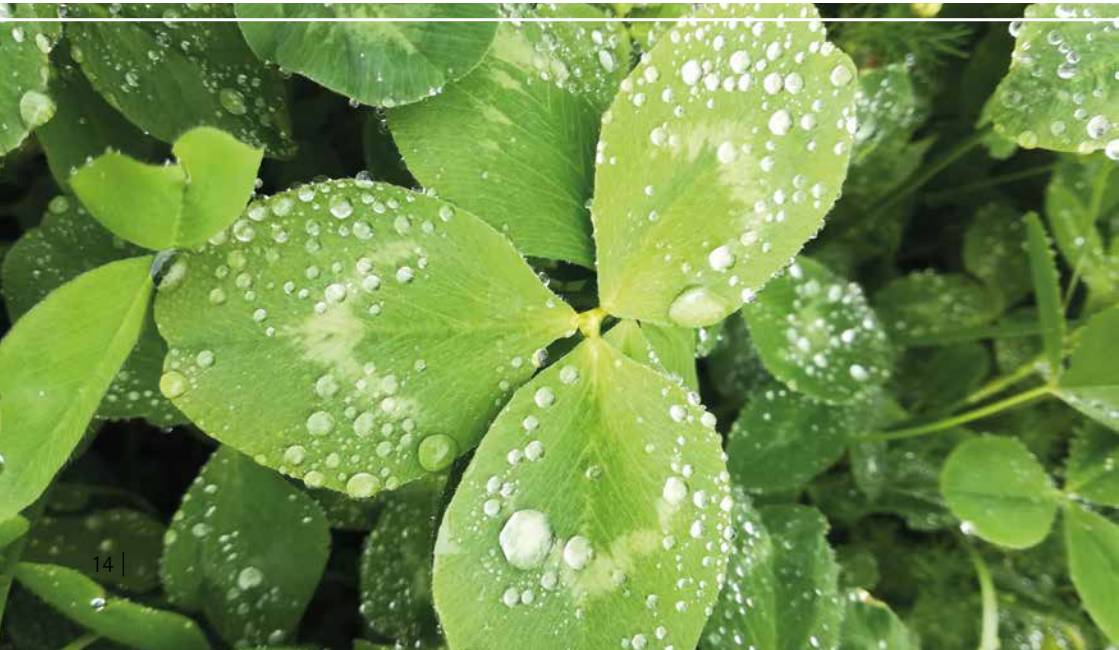
Bild 3: Klee und Luzerne sind auch ohne Viehhaltung für Humusaufbau, Unkrautregulierung und Stickstoffbindung unentbehrlich

Grundsätzlich sollte im Pflanzenbau mit einem Ertragsrückgang gerechnet werden, wobei die Höhe stark von der Kulturart abhängt (siehe Kapitel 5.5).