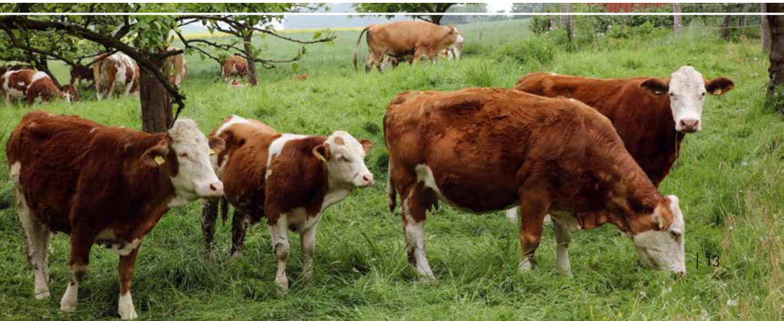
Bild 2: Rinder verwerten Raufutter auch im unwegsamem Gelände und liefern Dung für den Acker.

Hat die Analyse des Ist-Betriebs ergeben, dass die vorhandenen Ställe nicht den Anforderungen der EU-Öko-Verordnung (siehe Kapitel 7) oder Öko-Verbandsrichtlinien entsprechen, ist eine Anpassung erforderlich. Der Um- bzw. Neubau von Ställen muss kalkuliert und ggfs. bei der Investitionsplanung berücksichtigt werden. Der Zugang zu Freigelände, Ausläufen und Weiden und deren Bewirtschaftung müssen hierbei mitbedacht werden (siehe Kapitel 6.2).