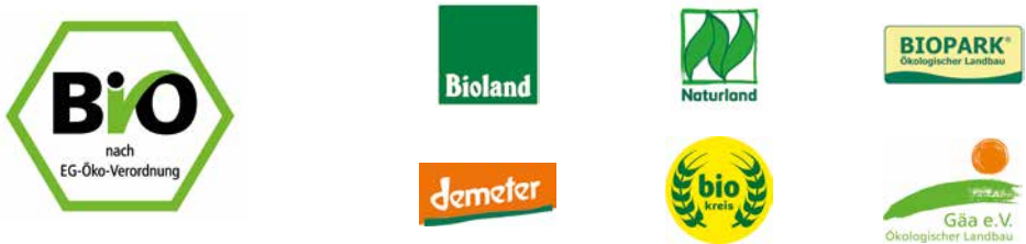
Abb. 4: Das deutsche Bio-Siegel (links) und Verbandslogos einiger deutscher Anbauverbände

→ www.oekolandbau.de/fileadmin/redaktion/dokumente/Bio-Siegel/Broschueren/2022_Bio-Siegel_Gewerbliche_Nutzung_Web.pdf