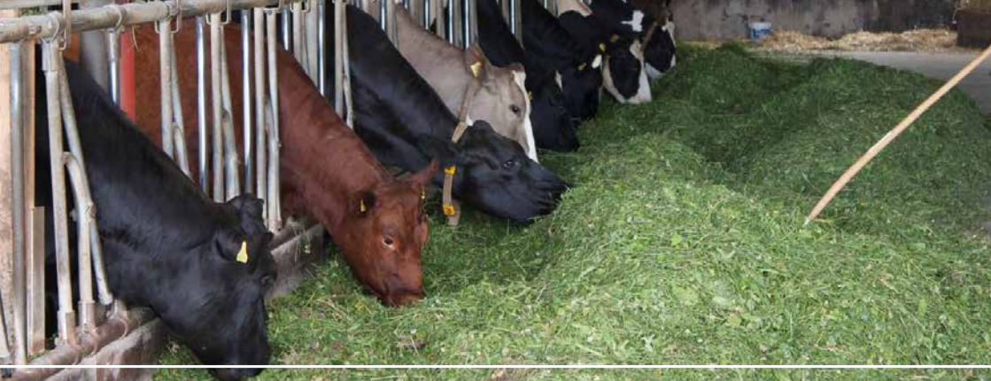
Bild 7: Futterherkunft und -anteile sind im Ökolandbau klar geregelt.