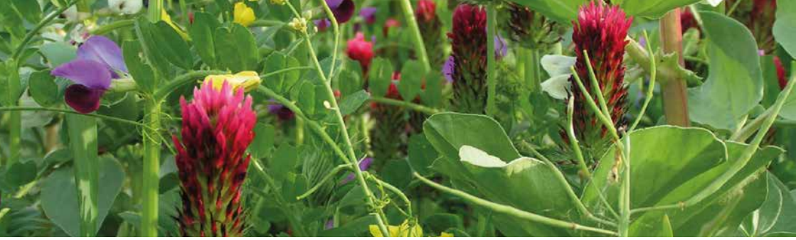
Bild 4: Dichte Zwischenfruchtbestände speichern die Nährstoffe über den Winter und lassen dem Unkraut kaum Wachstumschancen