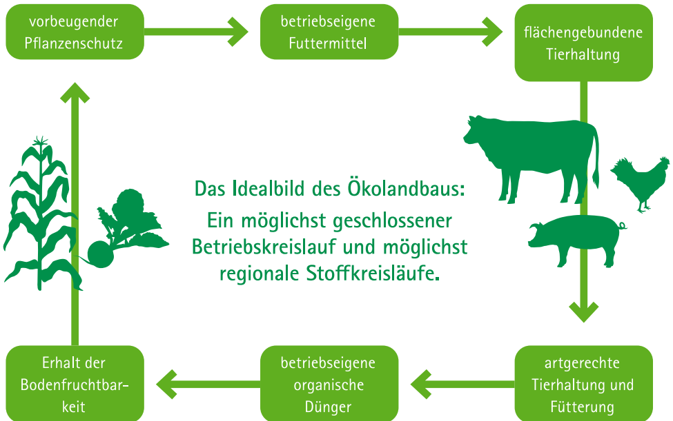
Abb. 2: Der Ökolandbau strebt regionale Stoffkreisläufe an

Die Nutztierhaltung steht im Ökolandbau in enger Beziehung zum Pflanzenbau. Einerseits ist sie ein wichtiges Bindeglied, indem über die Verwertung von Futterpflanzen Wirtschaftsdünger für den Pflanzenbau bereitgestellt wird. Andererseits ist der Tierbesatz an die verfügbare Fläche gebunden, um Umweltbelastungen durch zu hohe Nährstoffeinträge zu vermeiden und lokale bzw. regionale Kreisläufe zu stärken. Gemäß EU-Öko-Verordnung darf der Viehbesatz einen Nährstoffanfall von 170 kg N/ha und Jahr nicht überschreiten. In einzelnen Fällen, insbesondere bei der Fütterung, gehen die Richtlinien der deutschen Anbauverbände über die Anforderungen der EU-Öko-Verordnung hinaus.