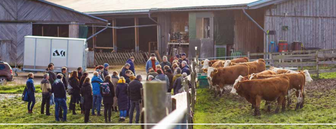
Bild 1: Betriebsbesuche und Feldbesichtigungen werden z.B. von Verbänden und Erzeugergemeinschaften angeboten.