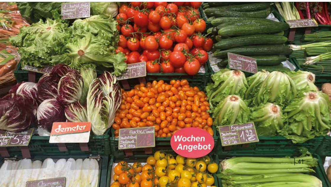
Bild. 8: So vielfältig wie die Erzeugnisse sind auch die Absatzwege.

Die Direktvermarktung landwirtschaftlicher Produkte rückt u. a. durch den Wunsch der Bevölkerung nach Transparenz, Regionalität und natürlicher Qualität zunehmend in den Fokus. Betrieben bietet sich der Vorteil, durch einen direkten Kontakt unmittelbares Feedback zu erhalten und so auf Wünsche und Erwartungen eingehen zu können. Für die Direktvermarktung bieten sich eine Vielzahl an Absatzwegen an. Sei es der Verkauf ab Feld, im eigenen Hofladen, auf Märkten oder online. Eine besondere Form der Direktvermarktung ist die solidarische Landwirtschaft (Solawi). Hier tragen mehrere Haushalte die Kosten eines landwirtschaftlichen Betriebs und treffen gemeinsam unternehmerische Entscheidungen. Im Gegenzug erhalten Sie anteilig dessen Ernteertrag. Hinter dieser Form der Betriebsorganisation stehen der Anspruch nach mehr Selbstbestimmung und der Wunsch nach einer, über die ökologischen Aspekte hinaus nachhaltigen Form der Landwirtschaft.