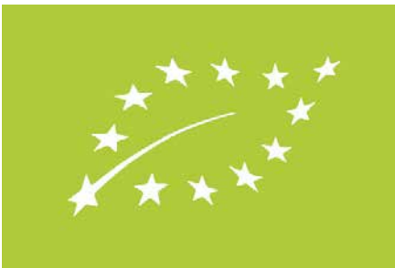
Abb. 3: Das EU-Bio-Logo

Für die Kennzeichnung von vorverpackten Bio-Produkten ist das Logo der Europäischen Union für ökologische/biologische Produkte verpflichtend. Dabei muss im Sichtfeld des EU-Bio-Logos der Ort der Erzeugung landwirtschaftlicher Ausgangsstoffe erscheinen, aus denen sich das Erzeugnis zusammensetzt: „EU-Landwirtschaft“, „Nicht-EU-Landwirtschaft“, oder „EU-/Nicht-EU-Landwirtschaft“. Bei nicht vorverpackten Bio-Produkten ist die Verwendung des Logos freiwillig. Für Umstellungsware darf das Logo nicht verwendet werden.