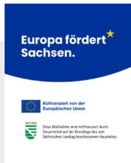
Hochformat Feed – 4:5

Auf der Website und sämtlichen Social-Media-Kanälen sind Ziele und Ergebnisse des Vorhabens zu nennen und die finanzielle Unterstützung durch die EU hervorzuheben. Der Umfang der Beschreibung steht im Verhältnis zum Umfang der Unterstützung.