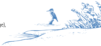
Schweddeybach / Flöha (Mittleres Erzgebirge)

... und sichert gleichzeitig das Überleben für Tiere und Pflanzen.