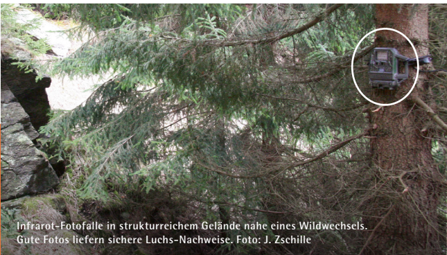
Infrarot-Fotofalle in strukturreichem Gelände nahe eines Wildwechsels. Gute Fotos liefern sichere Luchs-Nachweise.

Das seit 2008 bestehende Monitoringsystem zum Luchs wurde 2014 um die Wildkatze erweitert. In enger Kooperation mit dem BUND Landesverband Sachsen e. V. erfolgt