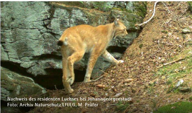
Nachweis des residenten Luchses bei Johanngeorgenstadt

Bereits seit den 1960er Jahren gibt es vermehrt Hinweise darauf, dass der Luchs auch wieder sächsische Wälder durchstreift. Vor allem im Oberlausitzer Bergland, der Sächsischen Schweiz, dem Erzgebirge und dem Vogtland hinterlässt das „Pinselohr“ in unregelmäßigen Abständen seine Spuren. So kommt es hin und wieder zu Einwanderungen aus anderen bestehenden Populationen. Im westlichen Erzgebirge hatte sich von 2013 bis 2019 sogar ein einzelnes männliches Tier etabliert. Und im Sommer 2020 hielten sich zeitweilig gleich drei Luchse aus einem polnischen Wiederansiedlungsprojekt in Sachsen auf.