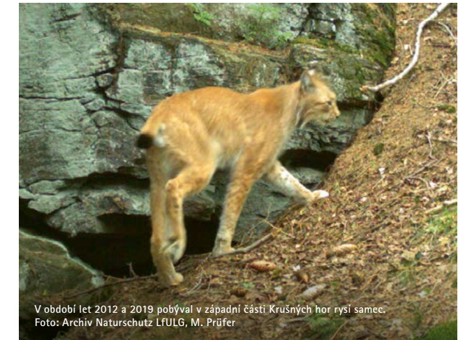
V období let 2012 a 2019 pobýval v západní části Krušných hor rysí samec.

Rysové budou vypuštěni do volné přírody bezprostředně po transportu na místo vypuštění a budou cíleně monitorováni. Všechna zvířata dostanou obojky s GPS lokátory, které budou pravidelně poskytovat informace o jejich pohybu. V příslušných oblastech budou dále rozmístěny fotopasti. Kromě toho budou zaznamenávány i informace o tom, kde byli rysí jedinci spatřeni a kde byly nalezeny jejich stopy či trus nebo jimi stržená zvěř. Takto sebraná data budou shromažďována na Katedře lesnické zoologie Technické univerzity Drážďany a využívána k výzkumným účelům. Na monitoringu se v Sasku budou podílet i myslivci svými nálezy rysů v rámci vlastního monitoringu divoké zvěře.