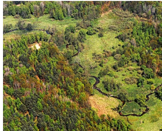
Die Pulsnitzzaue im NSG Königsbrücker Heide

■ unterhaltene Wander-/ Radwege: 85 km ■ Gesamtwaldfläche: 10.310 ha ■ Staatswald (Freistaat): 9.355 ha ■ Staatswald (Bund): 846 ha ■ Körperschaftswald: 1 ha ■ Kirchenwald: 8 ha ■ Privatwald: 97 ha ■ Treuhandrestwald: 2 ha