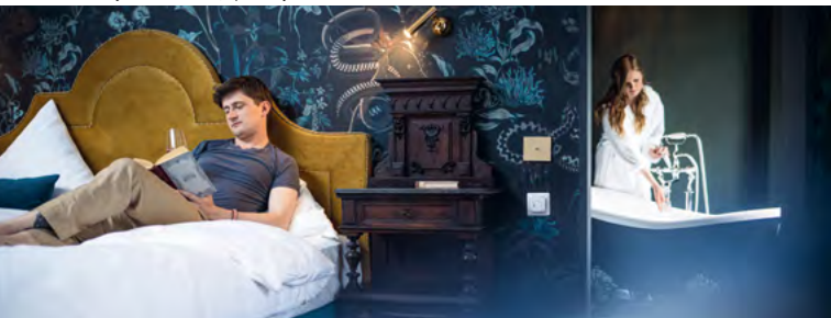
Zámecký hotel Althörnitz, apartmá junior

Ve dvou malebných domcích v parku žili kdysi zámecký trubač a zámecký vrátný. Dnes jsou v nich prázdninové byty, které návštěvníky rázem přenesou do pohádkových a idylických časů.