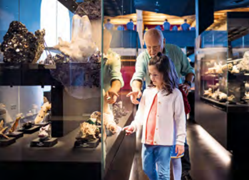
Zámek Freudenstein, „terra mineralia“