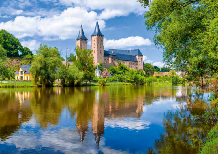
Zámek Rochlitz na Cvikovské Muldě