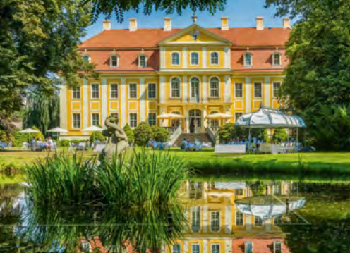
Barokní zámek Rammenuau