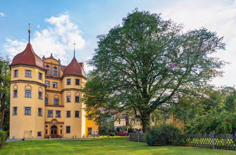
Zámecký hotel Althörnitz