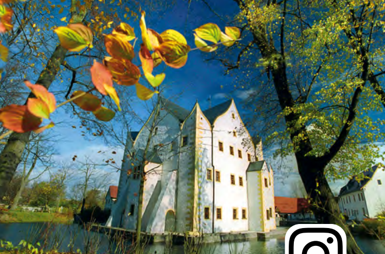
Vodní zámek Klaffenbach