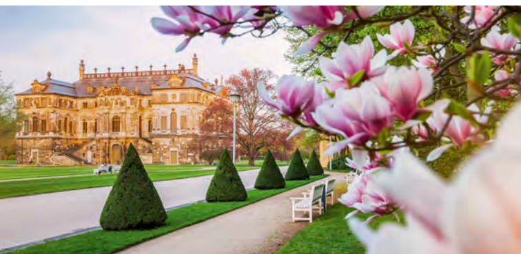
Velká zahrada Drážďany, palác

V romantickém zámeckém parku tě překvapí záplava nádherně barevných hortenzií. Tip: objevte malebný zámecký park během vzrušující prohlídky s průvodcem nebo si vychutnejte piknik pod širým nebem – zámecká kavárna vám do košíku přibalí spoustu dobrot!