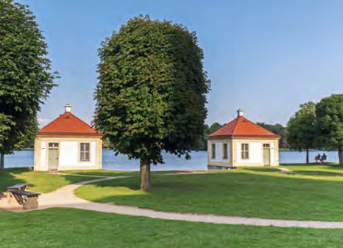
Rybniční domky, Moritzburg