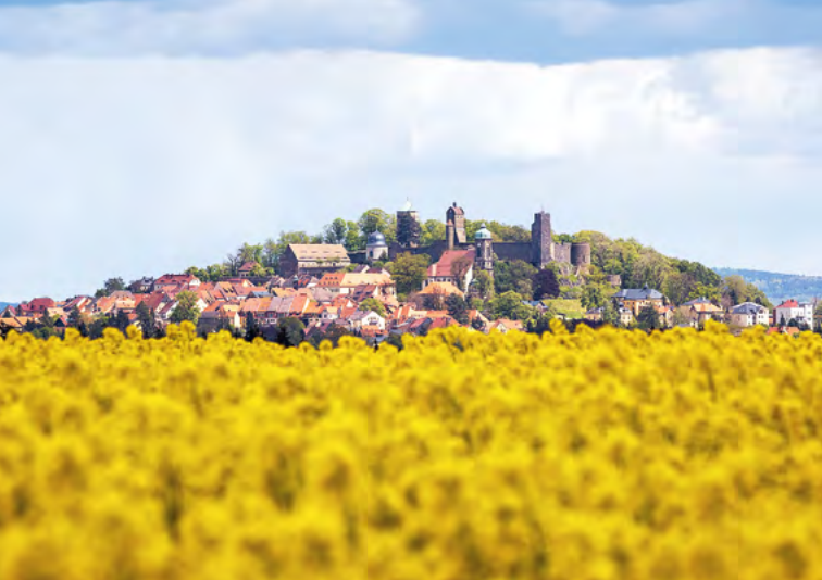
Pohled na hrad Stolpen