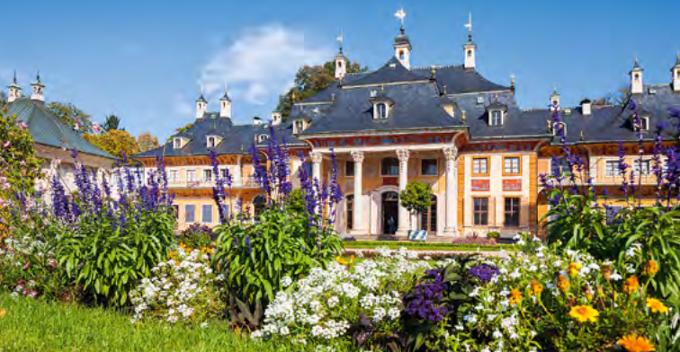
Zámek a park Pillnitz