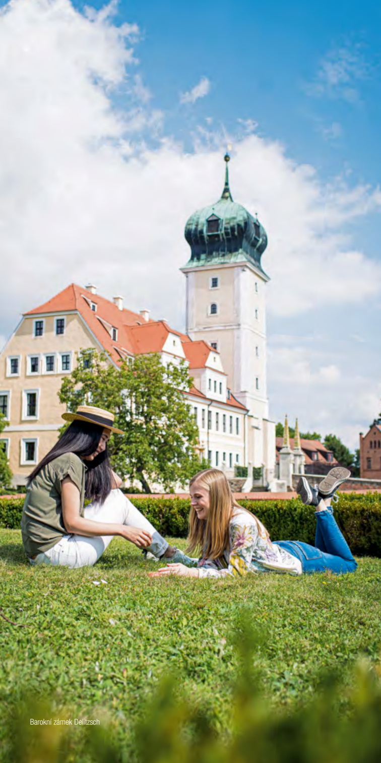
Barokní zámek Delitzsch