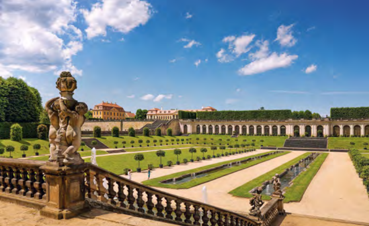
Barokní zahrada Großsedlitz