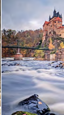
Hrad Kriebstein, foto: @m.zickmann_photography