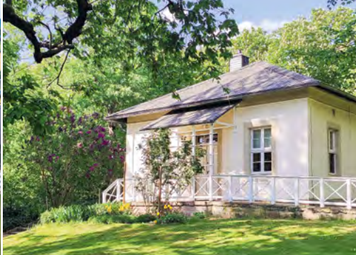
Zámecký park Pillnitz, prázdninové domy