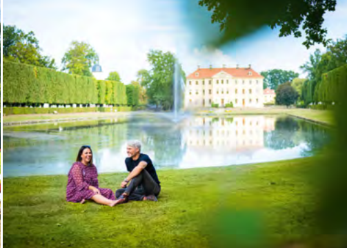
Barokní zahrada Zabeltitz