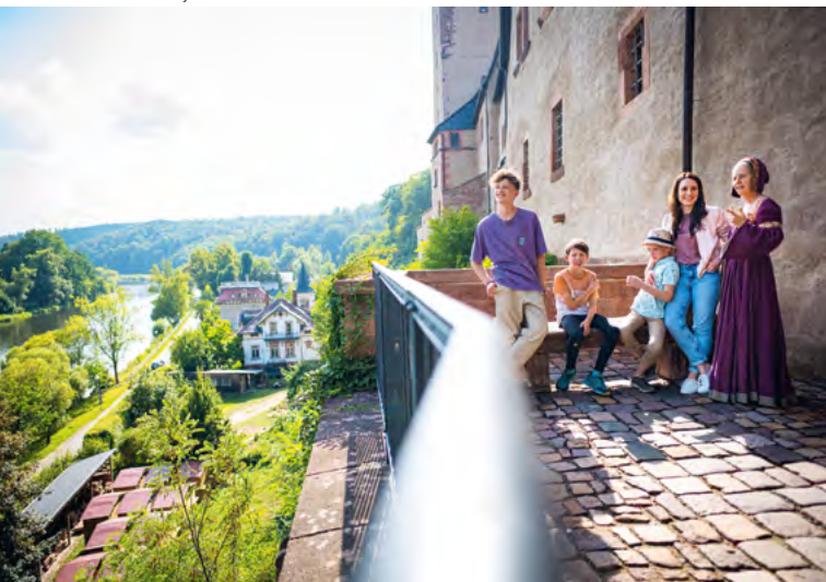
Zámek Rochlitz s výhledem na řeku Muldu

Tady se určitě vyplatí vystoupat na jednu ze dvou nápadných věží zvaných „jupky“. Výhled na údolí Cvikovské Muldy je ohromující. A když se zadíváš pozorně, uvidíš v jedné z věží díry od dělových koulí po ostřelování kanonem za třicetileté války.