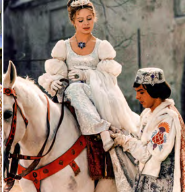
„Tři oříšky pro Popelku“, foto: s laskavým svolením společnosti ICESTORM Media GmbH a nadace DEFA