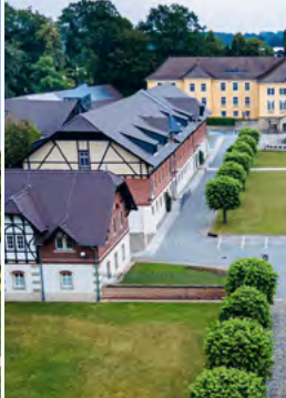
Vzdělávací centrum Schmochtitz sv. Benna