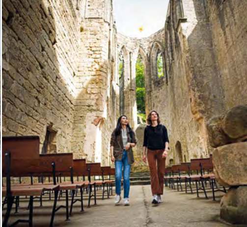
Hrad a klášter Oybin