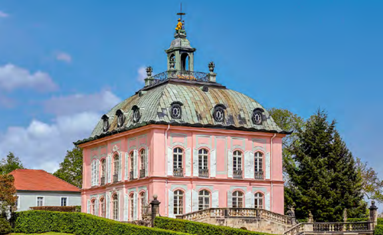
Bažantí zámek Moritzburg