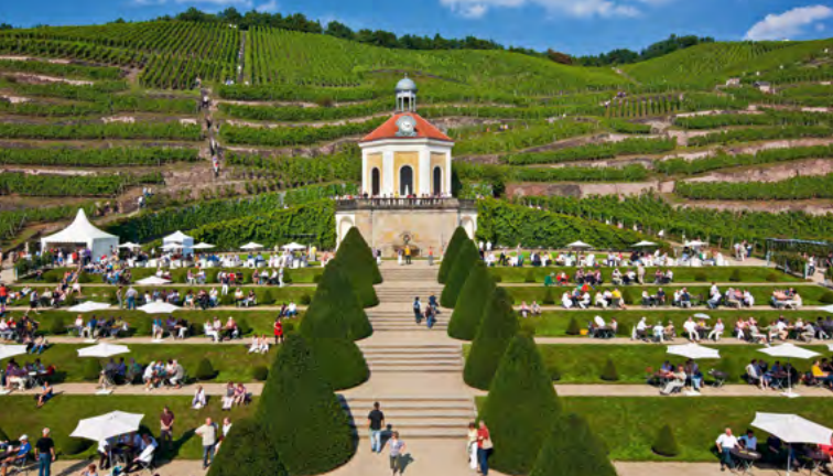
Zámek Wackerbarth, první zážitkové vinařství v Evropě