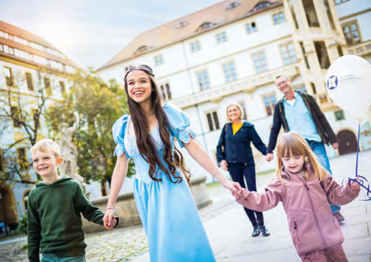
Zámek Hartenfels, „Šípková Růženka“