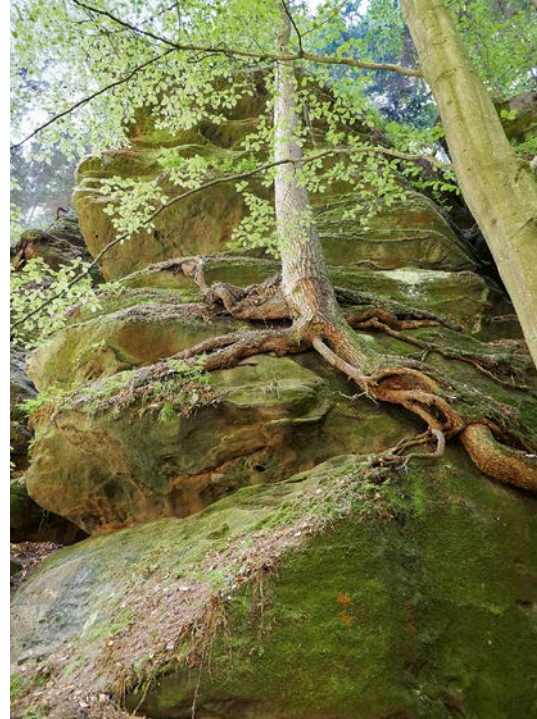
Spezialisten am Fels: Länger als ein Menschenleben klammert sich diese Kiefer an einer fast senkrechten Felswand fest