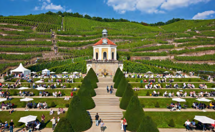
Schloss Wackerbarth, Europas erstes Erlebnisweingut