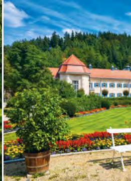
Königliche Anlagen Bad Elster