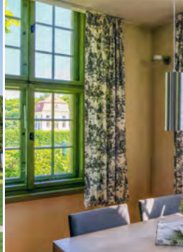
Essbereich im großen Teichhaus, Moritzburg