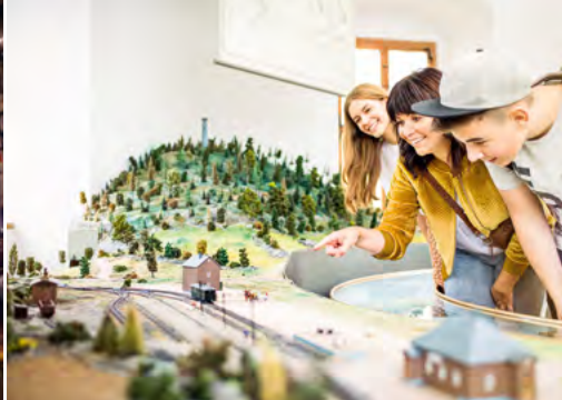
Schloss Lauenstein, Museum