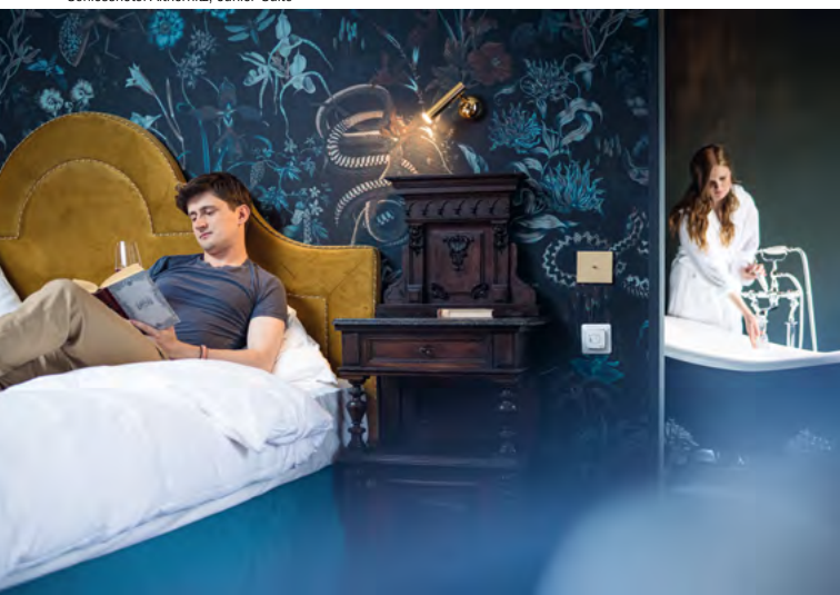
Schlossshotel Althörnitz, Junior-Suite

In den drei malerischen Häuschen im Parkgelände wohnten einst der Schlossportier, der Hoftrompeter und die Haiducken. Heute versetzen sie als Ferienwohnungen Reisende in eine märchenhaft-idyllische Zeit.