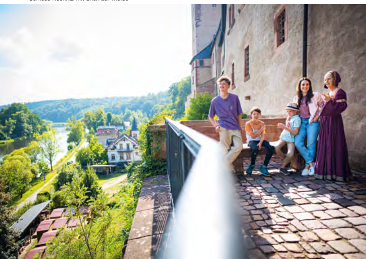
Schloss Rochlitz mit Blick zur Mulde

Der Aufstieg auf einen der beiden markanten Türme – Jupen genannt – lohnt sich! Der Ausblick ins Tal der Zwickauer Mulde ist überwältigend. Und wenn du genau hinschaust, entdeckst du in einem der beiden Türme noch die Einschusslöcher vom Kanonenbeschuss im 30-jährigen Krieg.