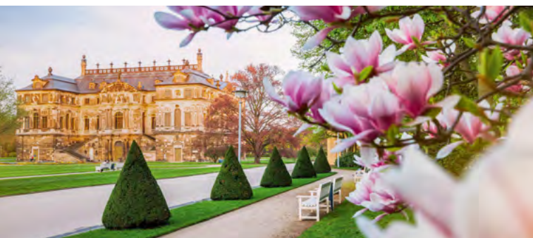
Großer Garten Dresden, Palais

In der neuen Dauerausstellung »Kuhstall und Silberteller« lernst du die ehemaligen Schlossbewohner kennen und tauchst ein in das Leben von Adel und Gesinde in Meierhof, Schloss und Park. Zwischendurch lädt das Schlosscafé zu einer kleinen Pause ein – mit hausgemachtem Kuchen, Eis und herzhaften Kleinigkeiten.