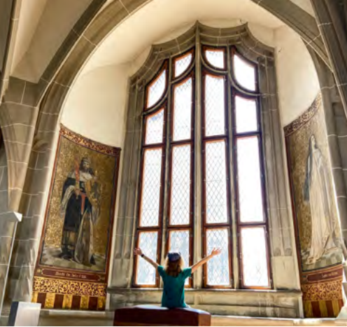
Albrechtsburg Meissen