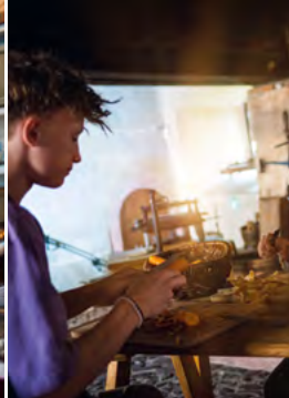
Schloss Rochlitz, Kochen wie im Mittelalter