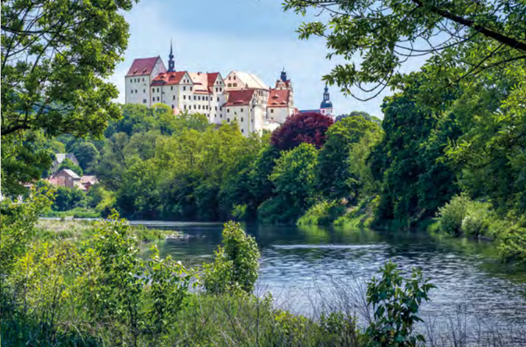
Schloss Colditz an der Zwickauer Mulde